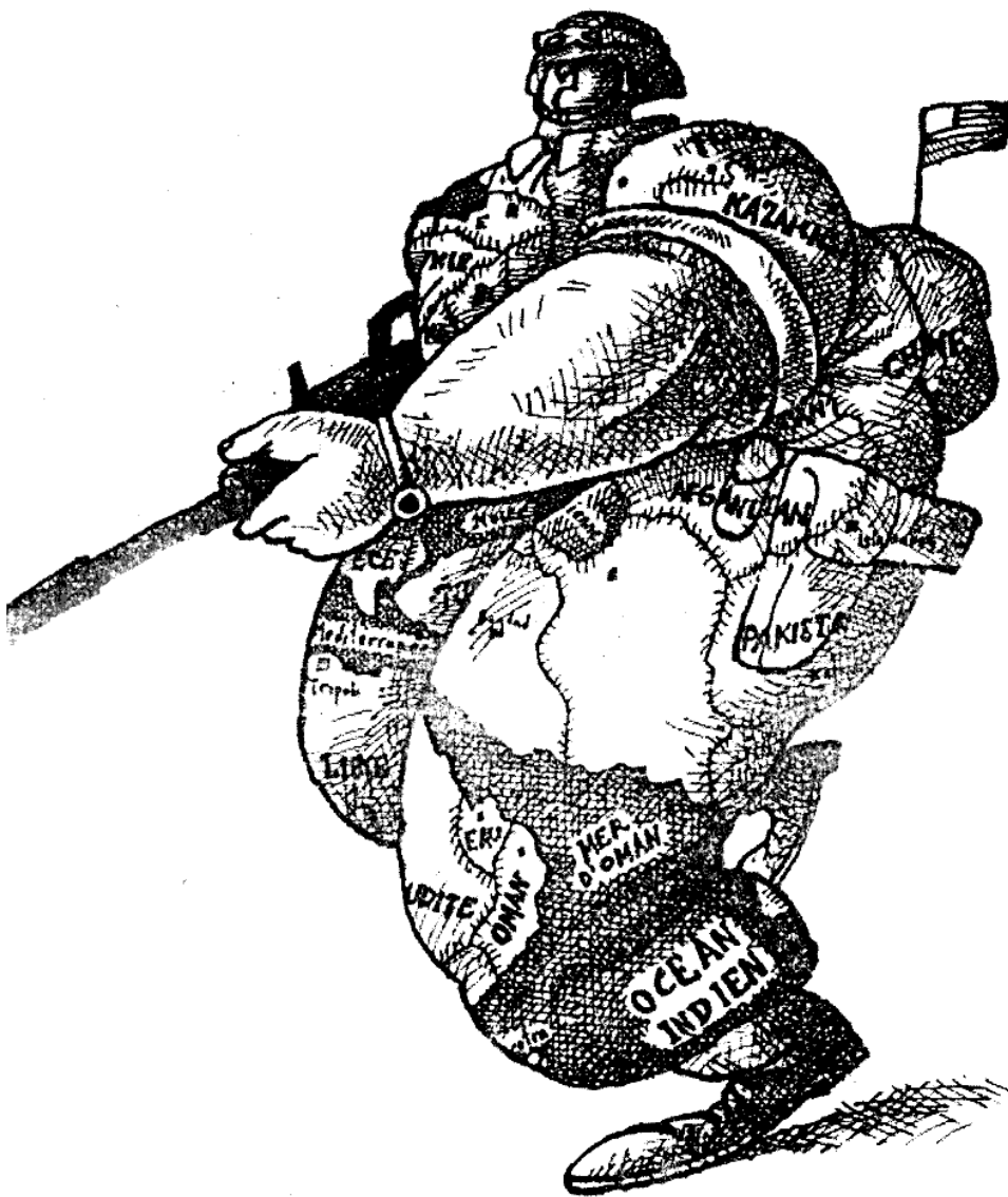
एस. के. गल्लस का र्टून